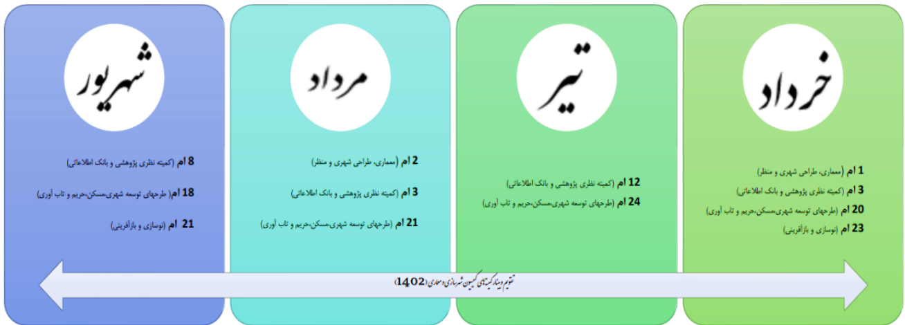
تصویر شماره ۳- نمونه تقویم زمانی برگزاری جلسات کمیته‌ها

تهدیه تقویم زمانی تخصصی برگزاری جلسات (مکاتبه با روسای کمیته های ذیل کمیسیون، ارسال برنامه زمانی برگزاری و بینارها، جمع بندی و تهيه تقویم زمانی تخصصی)